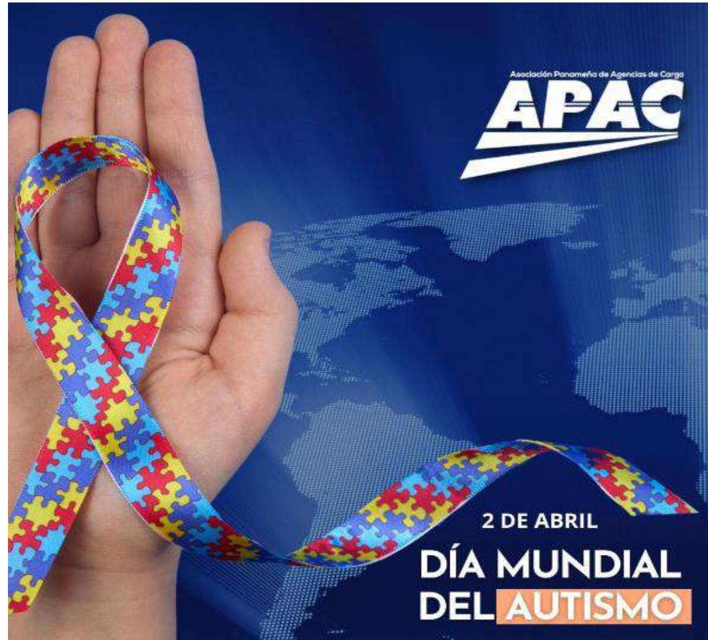
DÍA MUNDIA DEL AUTISMO 2 DE ABRIL