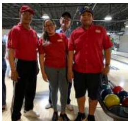
Tocumen Storage & Cargo Service.