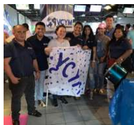
VCYM Transport and Logistics