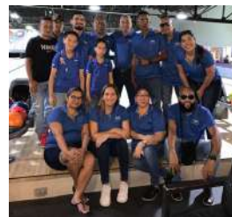
Air Sea Worldwide Panama, S.A.