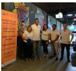
Quality Freight International.