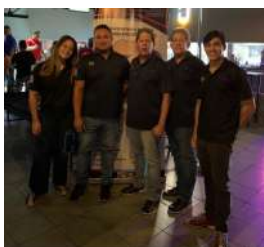
Servicarga, S. A.