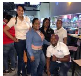
N2A Full Safe Logistics, S.A.