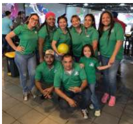
Air Sea Express Cargo, S.A.