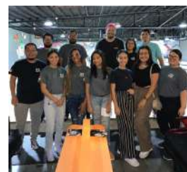
SSL International Group Corp.