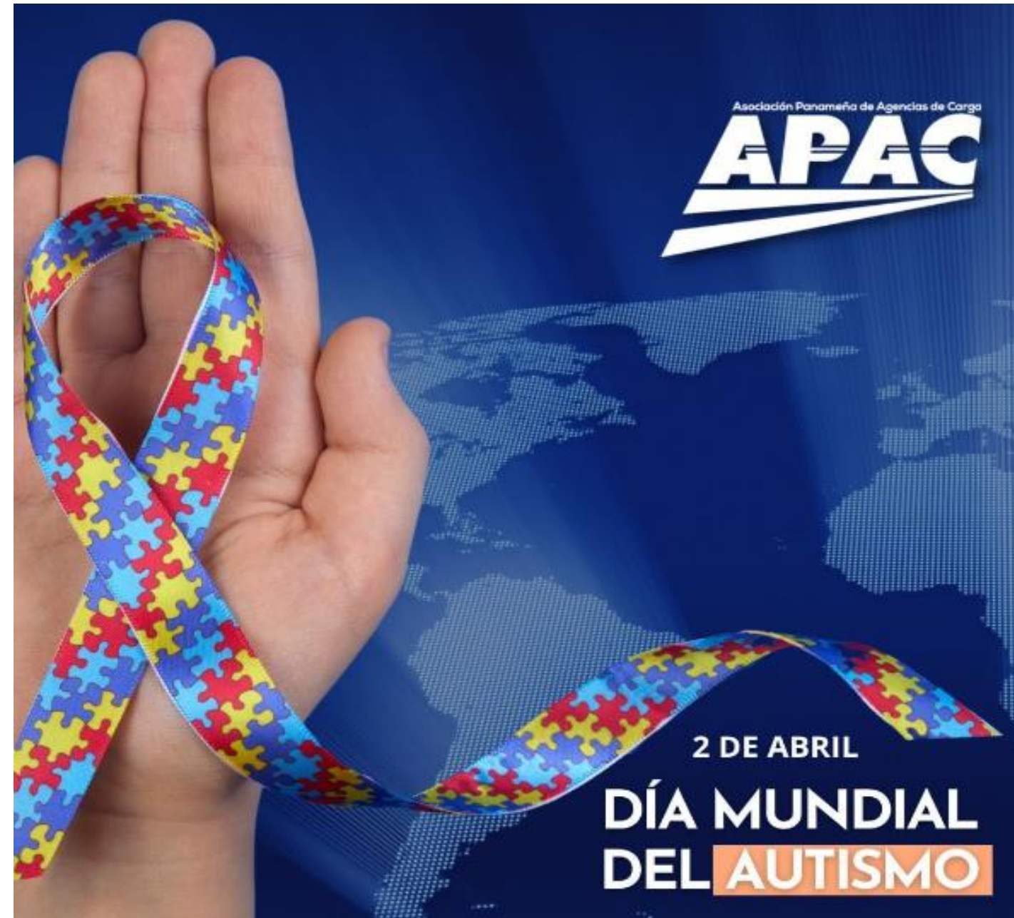
DÍA MUNDIA DEL AUTISMO 2 DE ABRIL