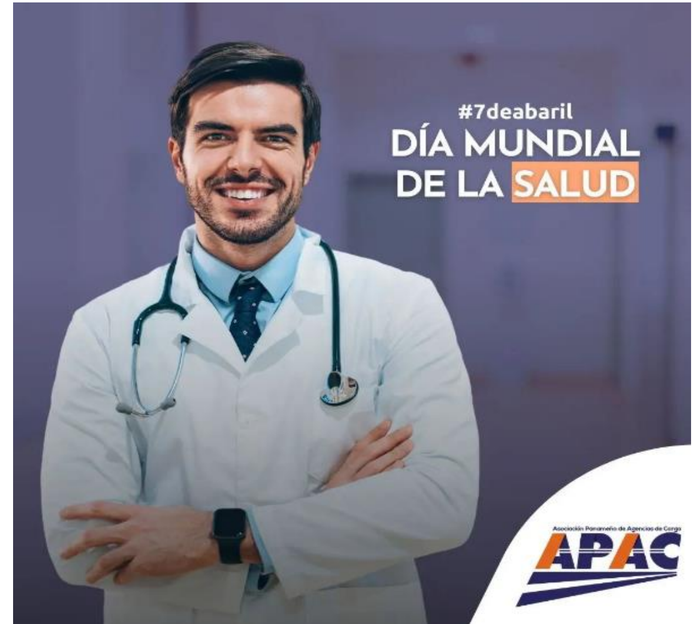
DIA MUNDIAL DE LA SALUD 7 DE ABRIL